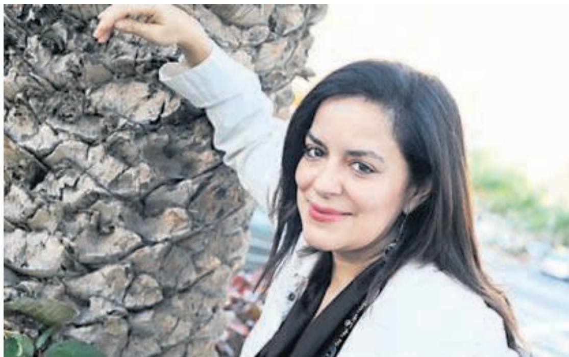
La cantante ofrece un recital hoy en el Teatro Guimerá.

“Me siento muy cómoda en un escenario, tanto en ópera como en recital. Lo que ocurre es que son experiencias diferentes. La ópera es muy bonita y un trabajo en conjunto. Pero lo que tiene el recital es que hay un contacto mucho más íntimo con el público y tú creas un programa con el que te sientes identificado, con el que quieres contar una historia al público y llevarlo a un viaje de emociones. Eso te ofrece muchas posibilidades porque puedes experimentar y explorar repertorios adecuados para tu voz, con el que de alguna manera puedes